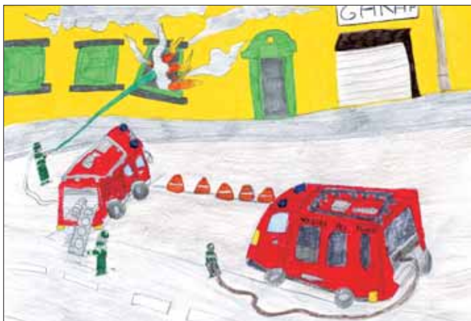
Caserma dei Vigili del Fuoco di Montevarchi

Il Corpo Nazionale dei Vigili del Fuoco affronta le numerose situazioni di emergenza del territorio; in particolare si occupa della prevenzione e dell'estinzione degli incendi.