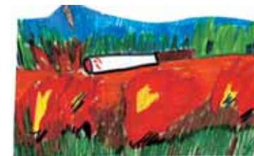
Imprudenza e disattenzione