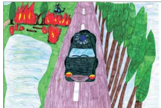
Caserma del Corpo Forestale dello Stato di Montevarchi

Il Corpo Forestale dello Stato è una Forza di Polizia dello Stato specializzata nella tutela dell'ambiente e del paesaggio. E' anche una delle strutture operative nazionali della Protezione Civile accanto ai Vigili del Fuoco e alle altre Forze di Polizia.